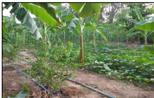
ที่มาทั้งสามแถว : จากการสำรวจโดยทีมงานคณะกรรมการดำเนินงานโครงการ พ.ศ. 2559