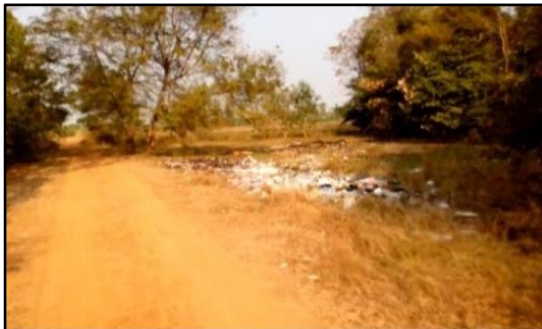
ภาพที่ 4 พื้นที่บริเวณริมหนองตาแบนในอดีตเป็นพื้นที่ทิ้งขยะขาดการดูแลจากชุมชน ปี พ.ศ. 2551