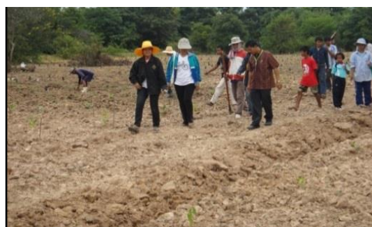
ภาพที่ 7 แปลงเกษตรผสมผสานโดยความร่วมมือจากสถาบันวิจัยและชาวบ้านร่วมแรงร่วมใจกันเข้ามาใช้ประโยชน์ร่วมกัน พลิกพื้นผิวดินให้อุดมสมบูรณ์อีกครั้ง