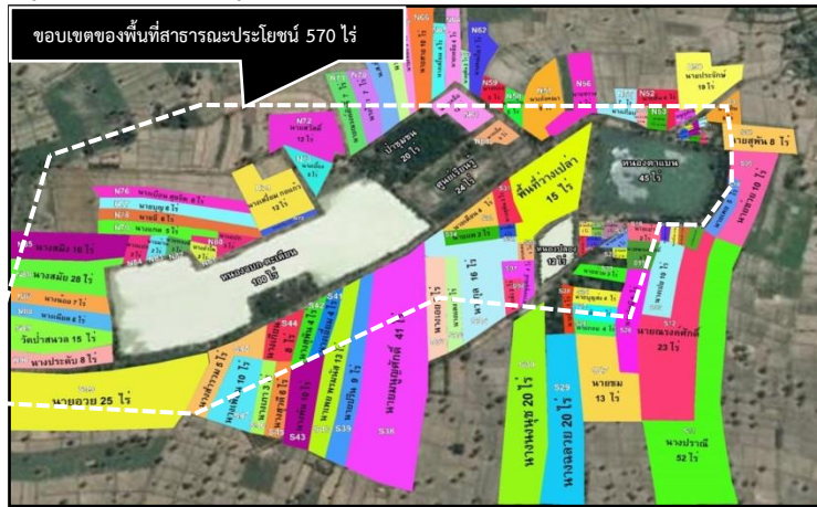
ที่มา : จากการสำรวจโดยทีมงานคณะกรรมการดำเนินงานโครงการ พ.ศ. 2559