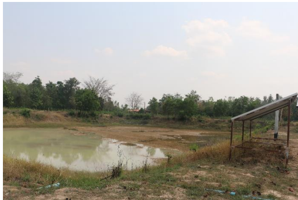
ภาพที่ 1.11.2 แหล่งน้ำช่วยเหลือศูนย์ศิลปาชีพ ตำบลลำดวน อำเภอกะสัง แห่งที่ 2 ปัจจุบันมีปริมาณน้ำน้อยมาก