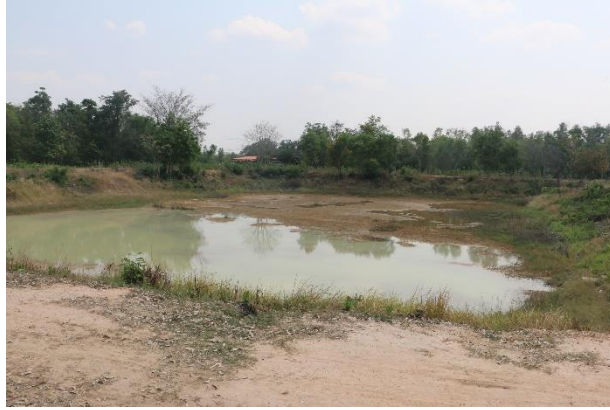
ภาพที่ 1.11.1 แหล่งน้ำช่วยเหลือศูนย์ศิลปาชีพ ตำบลลำดวน อำเภอกะสัง แห่งที่ 1 ปัจจุบันมีปริมาณน้ำน้อยมาก