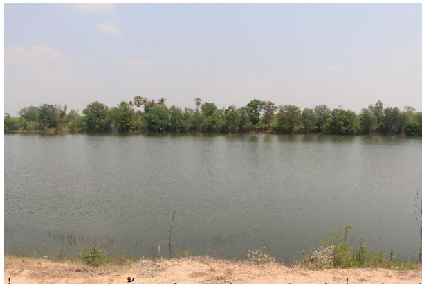
ภาพที่ 1.11.3 แหล่งน้ำศูนย์ศิลปาชีพกระสัง แห่งที่ 3 ปัจจุบันมีน้ำ ปริมาณปานกลาง หรือประมาณ 2 ส่วน 4 ของความจุอ่าง