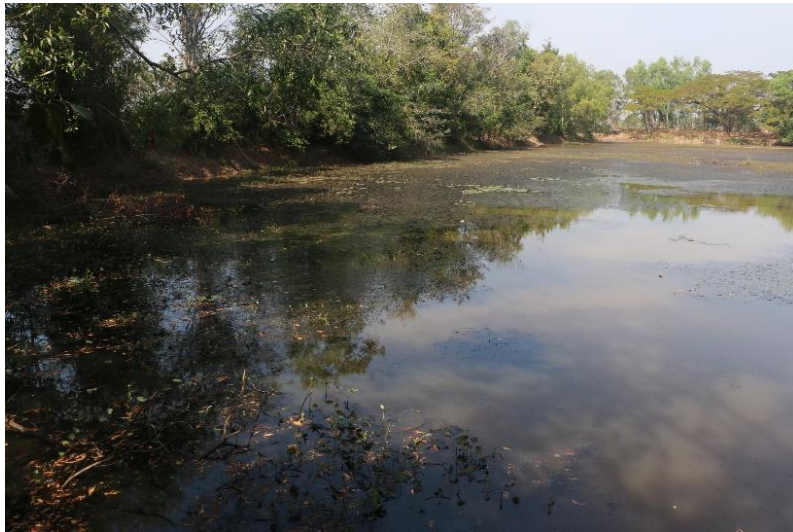
ภาพที่ 1.12.1-1.12.2 ภาพหนองไทร ตำบลลำตวน อำเภอกระสัง จังหวัดบุรีรัมย์