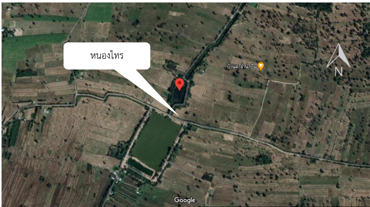
ภาพที่ 1.12.3 แผนที่แสดงที่ตั้งแหล่งน้ำ หนองไทร ตำบลลำตวน อำเภอกะสัง จังหวัดบุรีรัมย์