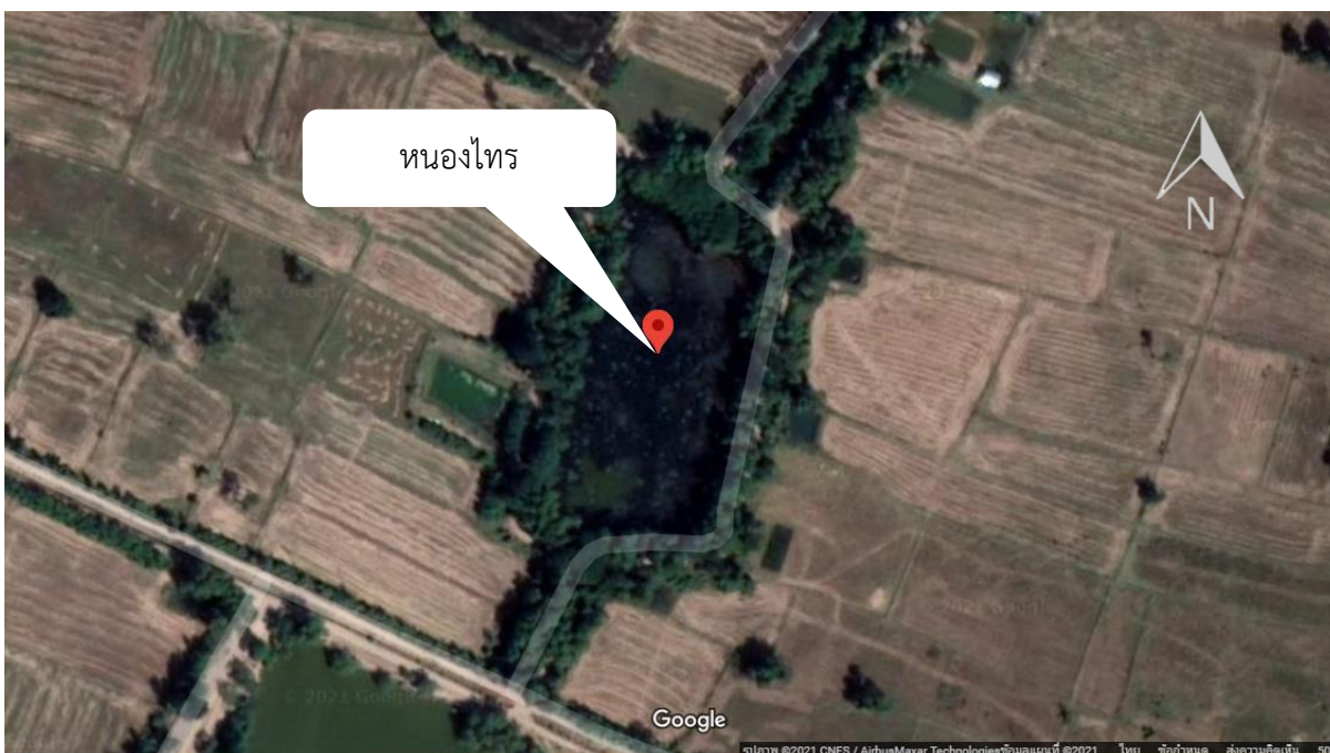
ภาพที่ 1.12.4 แผนที่แสดงรายละเอียดแหล่งน้ำ หนองไทร ตำบลลำตวน อำเภอกะสัง จังหวัดบุรีรัมย์