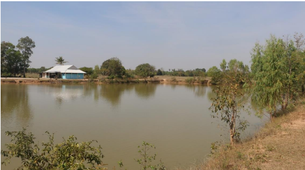
ภาพที่ 1.8.1-1.8.2 ภาพหนองสามมือ ตำบลลำตวน อำเภอกะสัง จังหวัดบุรีรัมย์