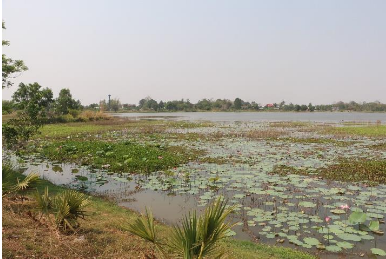
ภาพที่ 2.1.1 หนองฮาง ปัจจุบันน้ำในอ่างมีปริมาณอยู่ประมาณ 2 ส่วน 4 ของความจุอ่าง