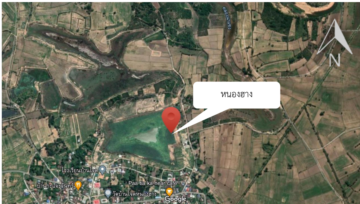
ภาพที่ 2.1.5 แผนที่แสดงรายละเอียดแหล่งน้ำ หนองฮาง ตำบลปะเคียบ อำเภอคูเมือง จังหวัดบุรีรัมย์