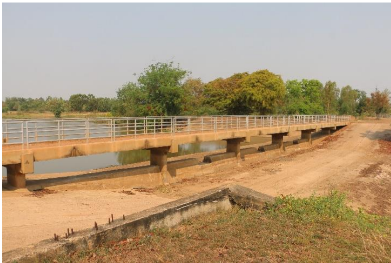
ภาพที่ 2.1.2 อาคารประกอบเชื่อมกับคลองนาแซง (ลำนาแซง) เพื่อทดน้ำ รับน้ำเข้า และระบายน้ำออก