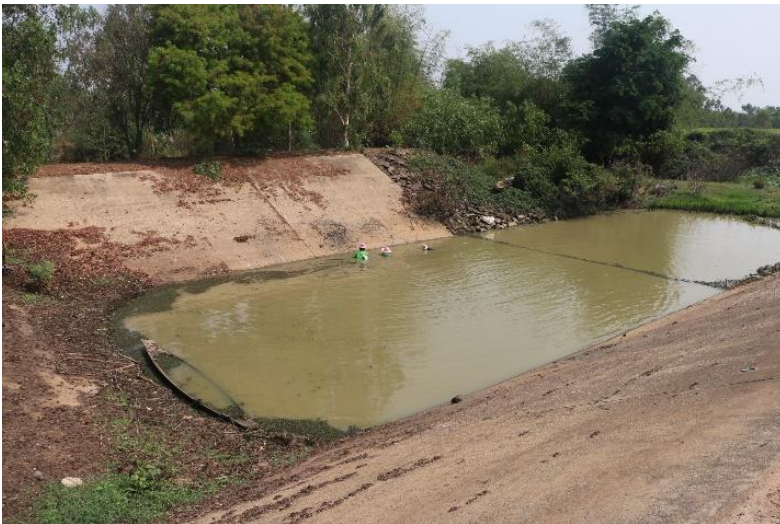
ภาพที่ 2.1.3 บริเวณอาคารประกอบเชื่อมกับคลองนาแซง มีปริมาณน้ำน้อยมาก