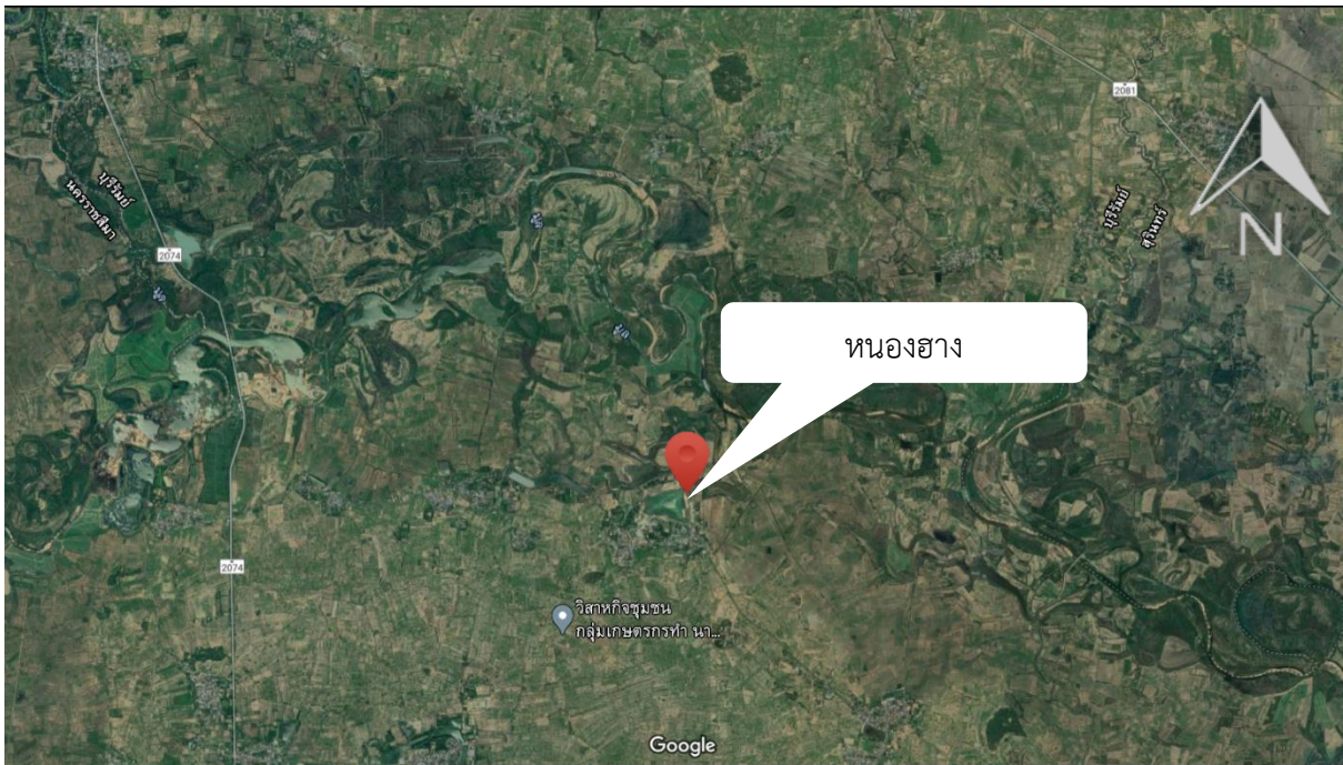
ภาพที่ 2.1.4 แผนที่แสดงที่ตั้งแหล่งน้ำ หนองฮาง ตำบลปะเคียบ อำเภอคูเมือง จังหวัดบุรีรัมย์