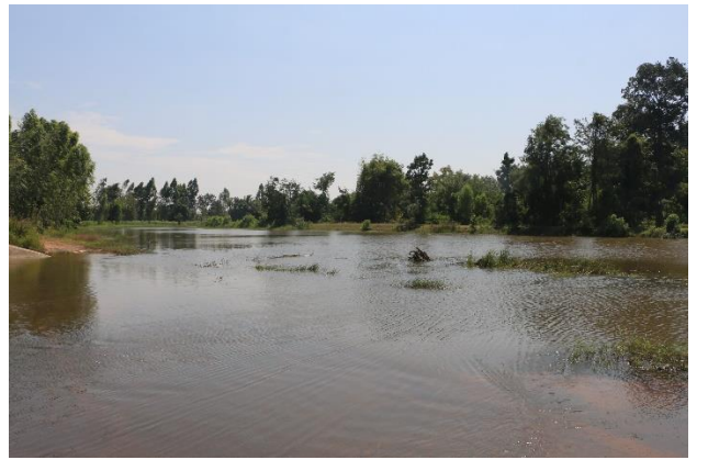
ภาพที่ 4.2.1-4.2.4 ฝ่ายบ้านกุดตาสาปัจจุบันมีน้ำเต็มความจุ