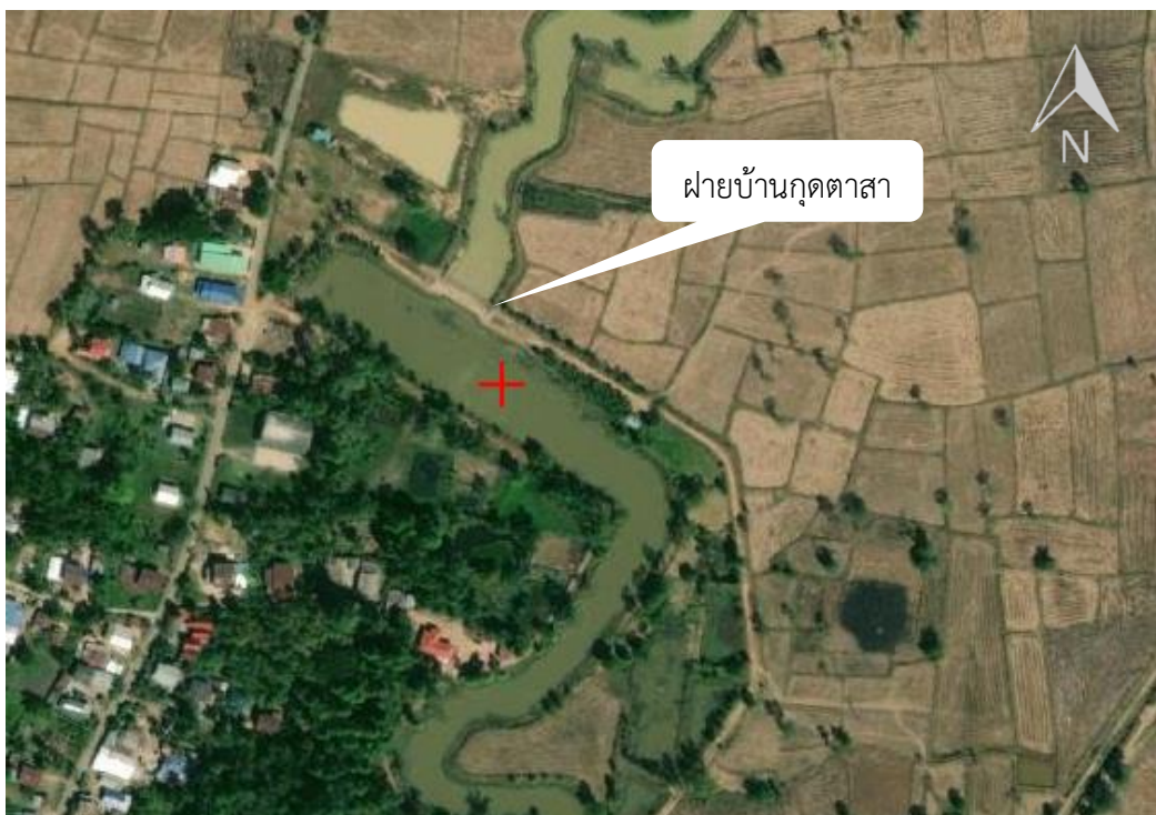
ภาพที่ 4.2.6 แผนที่แสดงรายละเอียดแหล่งน้ำ ฝายบ้านกุดตาสา ตำบลหนองไทร อำเภอนางรอง จังหวัดบุรีรัมย์