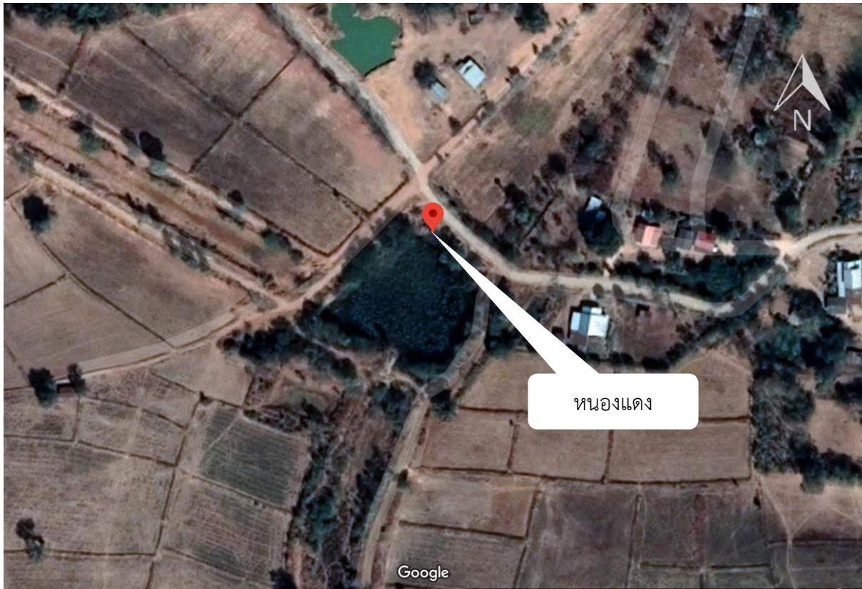
ภาพที่ 5.1.7 แผนที่แสดงรายละเอียดแหล่งน้ำ หนองแดง ตำบลดอนกอก อำเภอนาโพธิ์ จังหวัดบุรีรัมย์