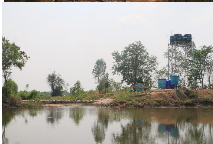
ภาพที่ 5.1.3-5.1.4 มีการสูบน้ำจากอ่างเพื่อใช้ในการเกษตร