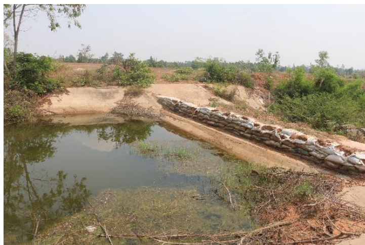
ภาพที่ 5.1.5 ฝายน้ำล้นจากหนองแดงด้านท้ายอ่าง