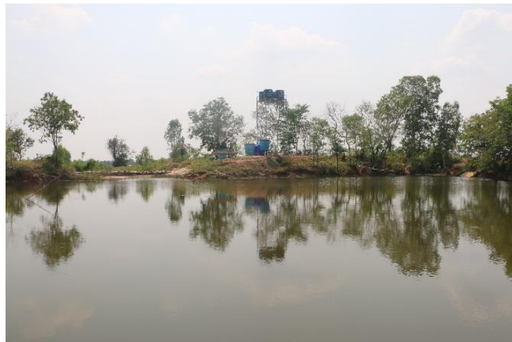
ภาพที่ 5.1.1-5.1.2 แหล่งน้ำหนองแดง ปัจจุบันมีน้ำอยู่ประมาณ 2 ส่วน 4 ของความจุอ่าง