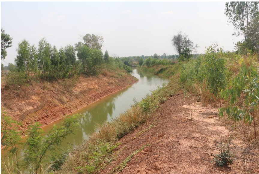
ภาพที่ 5.6.2 แหล่งน้ำห้วยตุ้มกา ปัจจุบันมีปริมาณน้ำในระดับน้อย ประมาณ 20 เปอร์เซ็นต์ของความจุ