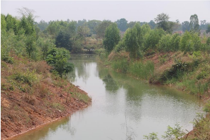
ภาพที่ 5.6.1 แหล่งน้ำห้วยตุ้มกา บริเวณที่ติดกับหนองแดงและเคยมีการขุด