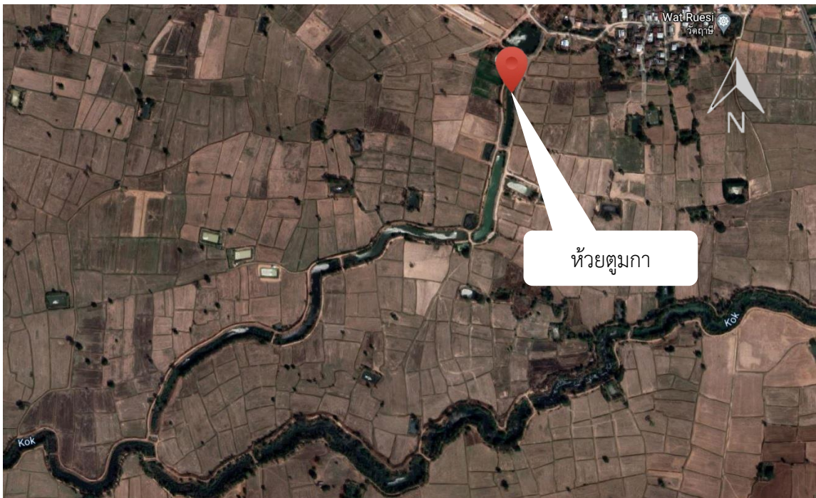
ภาพที่ 5.6.4 แผนที่แสดงรายละเอียดแหล่งน้ำ ห้วยตุมกา ตำบลอนกอก อำเภอนาโพธิ์ จังหวัดบุรีรัมย์