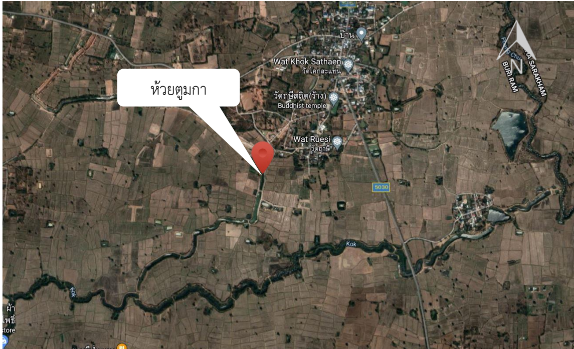
ภาพที่ 5.6.3 แผนที่แสดงที่ตั้งแหล่งน้ำ ห้วยตุมกา ตำบลอนกอก อำเภอนาโพธิ์ จังหวัดบุรีรัมย์