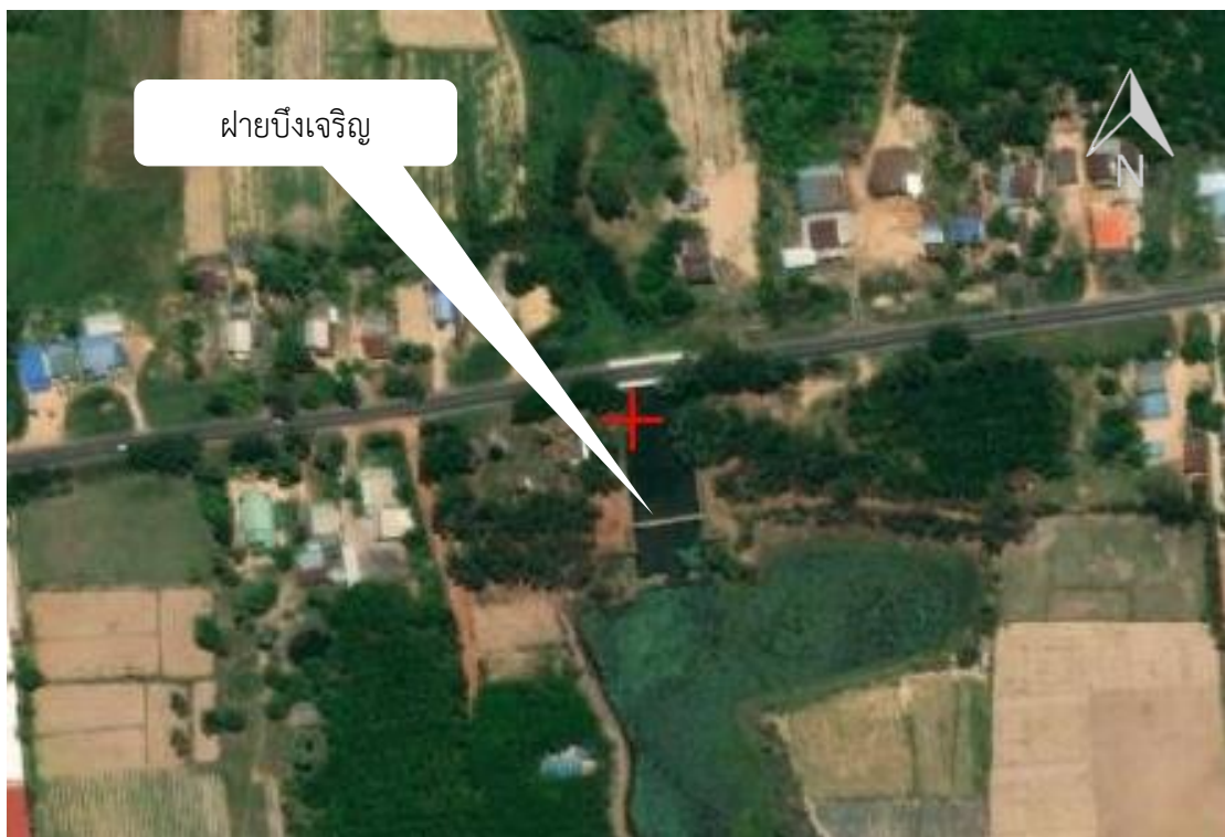
ภาพที่ 7.2.6 แผนที่แสดงรายละเอียดแหล่งน้ำ ฝายบึงเจริญ ตำบลบึงเจริญ อำเภอบ้านกรวด จังหวัดบุรีรัมย์