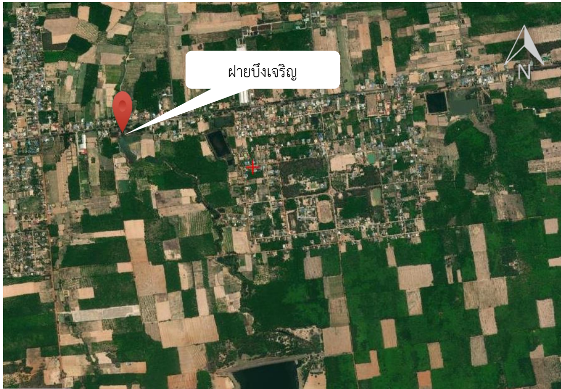
ภาพที่ 7.2.5 แผนที่แสดงที่ตั้งแหล่งน้ำ ฝายบึงเจริญ ตำบลบึงเจริญ อำเภอบ้านกรวด จังหวัดบุรีรัมย์