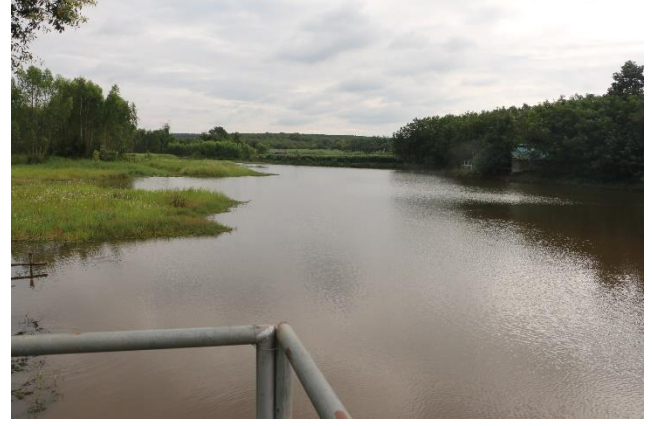
ภาพที่ 7.2.1-7.2.4 ฝ่ายเบี่ยงเจริญปัจจุบันมีน้ำเต็มความจุ