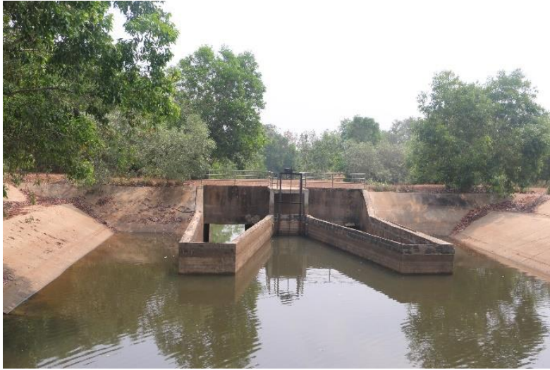
ภาพที่ 11.1.1 ฝ่ายห้วยตะแบก ปัจจุบันสภาพใช้งานได้ปกติ