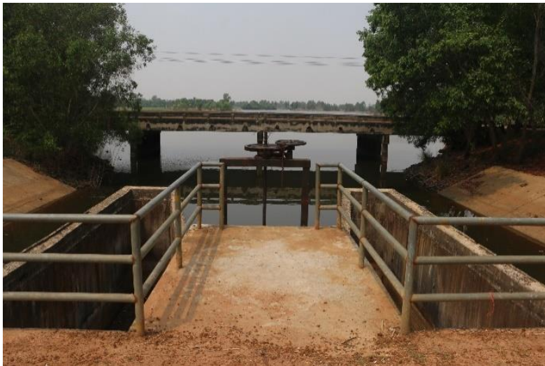
ภาพที่ 11.1.2 มีประตูเปิด-ปิดน้ำ สภาพใช้งานได้