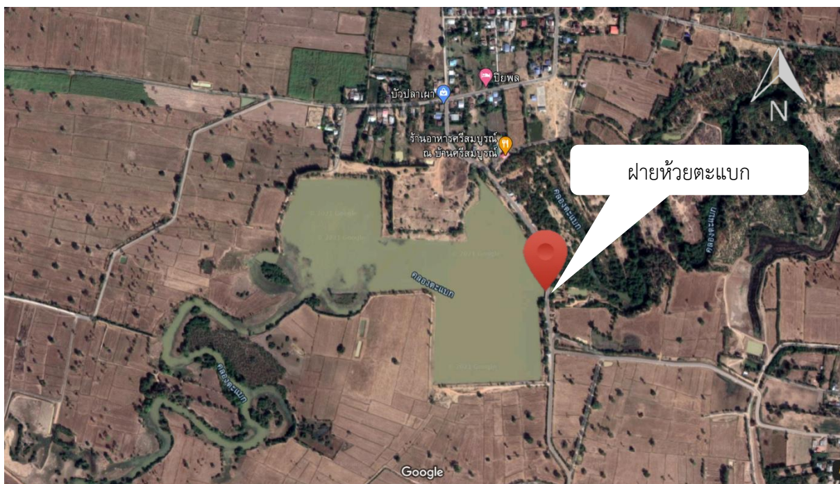
ภาพที่ 11.1.5 แผนที่แสดงรายละเอียดแหล่งน้ำ ฝายห้วยตะแบกพร้อมอาคารประกอบ ตำบลโคกขมิ้น อำเภอพลับพลาชัย จังหวัดบุรีรัมย์