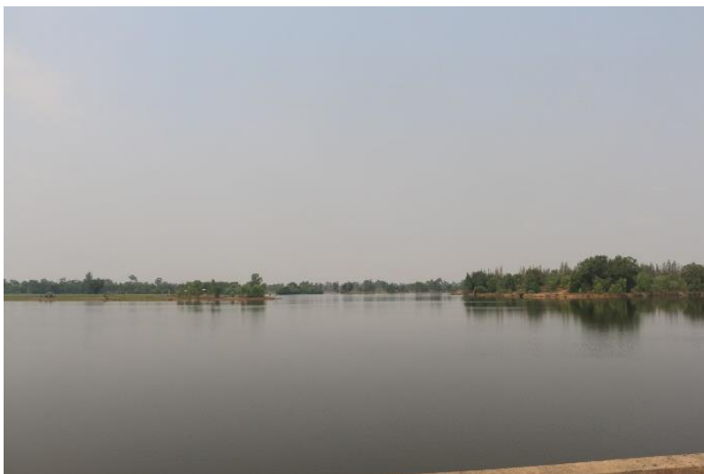
ภาพที่ 11.1.3 ฝ่ายห้วยตะแบก ปัจจุบันมีปริมาณน้ำในระดับพอดี