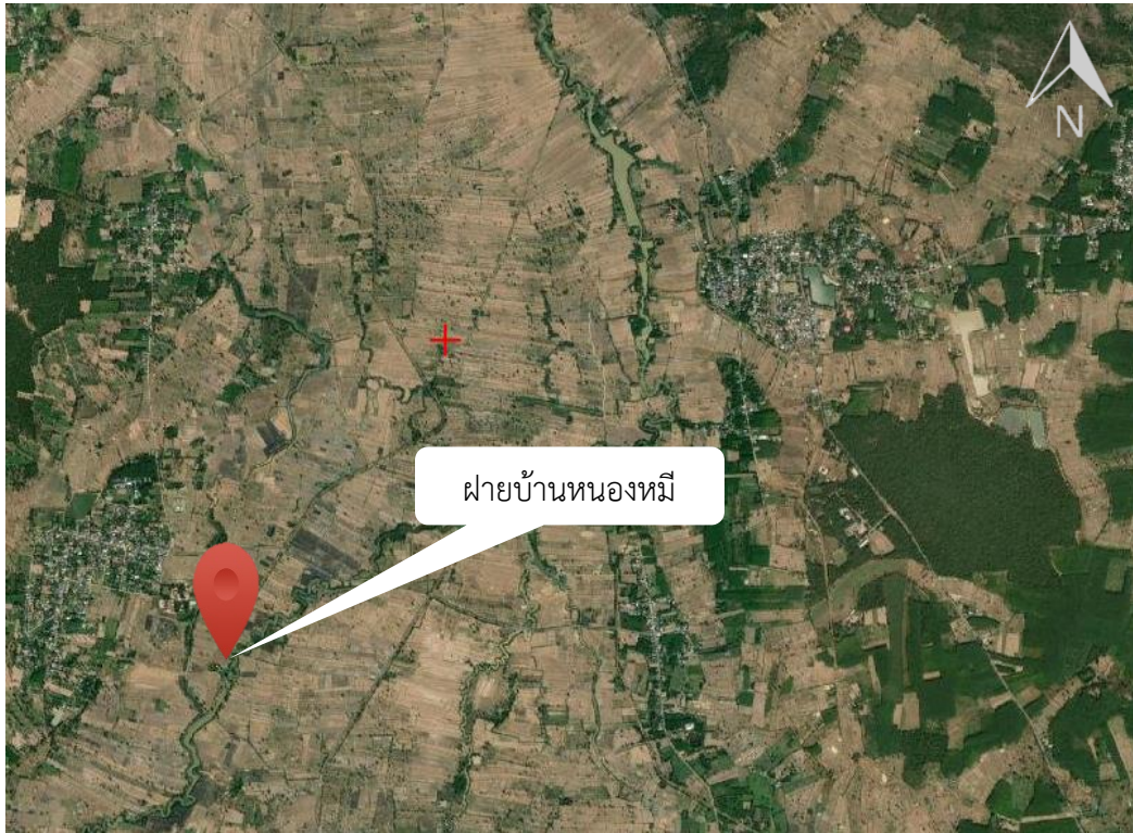
ภาพที่ 13.10.5 แผนที่แสดงที่ตั้งแหล่งน้ำ ฝายบ้านหนองหมี่ ตำบลโคกกว่าน อำเภอละหานทราย จังหวัดบุรีรัมย์