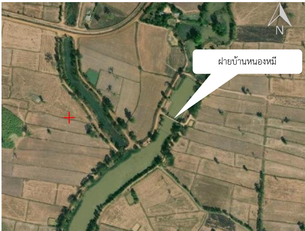
ภาพที่ 13.10.6 แผนที่แสดงรายละเอียดแหล่งน้ำ ฝายบ้านหนองหมี่ ตำบลโคกกว่าน อำเภอละหานทราย จังหวัดบุรีรัมย์