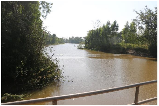
ภาพที่ 13.10.1-13.10.4 ฝ่ายบ้านหนองหมี่ปัจจุบันมีน้ำประมาณ 90 เปอร์เซ็นต์ของความจุ