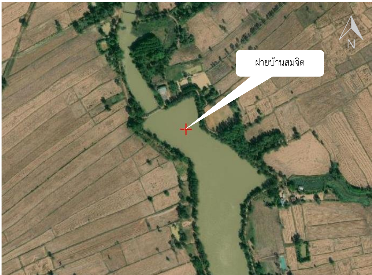
ภาพที่ 13.11.6 แผนที่แสดงรายละเอียดแหล่งน้ำ ฝายบ้านสมจิต ตำบลโคกกว่าน อำเภอละหานทราย จังหวัดบุรีรัมย์