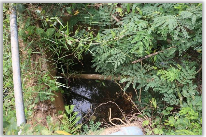
ภาพที่ 13.11.3-13.11.4 มีระบบน้ำล้น และคลองส่งน้ำแบบคลองดินสภาพปัจจุบันค่อนข้างรกทึบ