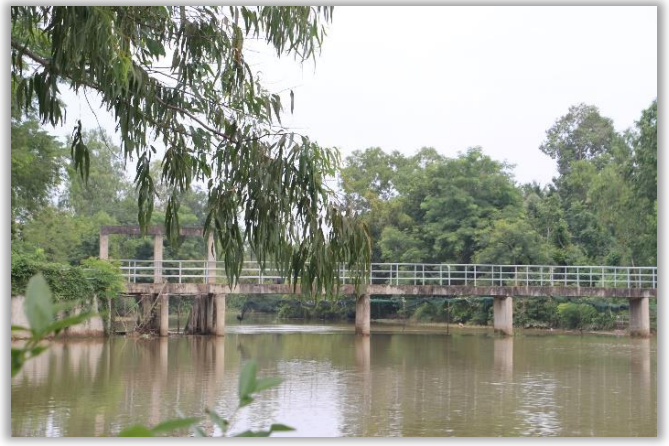
ภาพที่ 13.11.1-13.11.2 ฝ่ายบ้านสมจิตปัจจุบันมีน้ำเต็มความจุ