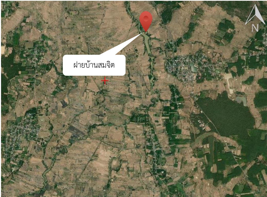
ภาพที่ 13.11.5 แผนที่แสดงที่ตั้งแหล่งน้ำ ฝายบ้านสมจิต ตำบลโคกกว่าน อำเภอละหานทราย จังหวัดบุรีรัมย์