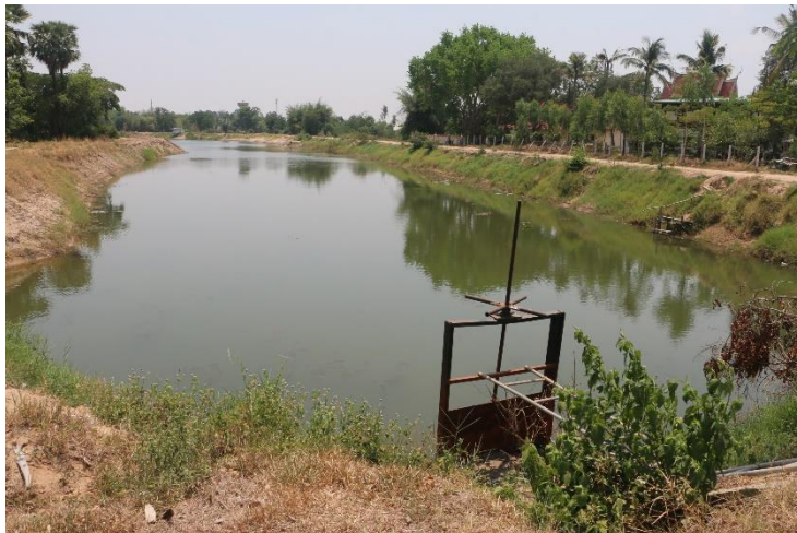
ภาพที่ 15.1.2 มีประตูเปิด-ปิดน้ำ สภาพใช้งานได้ปกติ