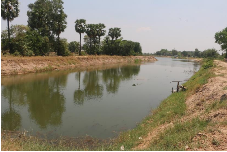
ภาพที่ 15.1.1 หนองบัว ปัจจุบันมีปริมาณน้ำน้อย