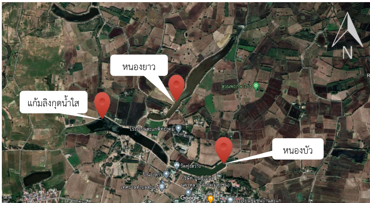
ภาพที่ 15.1.8 แผนที่แสดงรายละเอียดแหล่งน้ำ แก้มลิงกุดน้ำใส-หนองบัว-หนองยาว พร้อมอาคารประกอบ ตำบลสะแก อำเภอสตึก จังหวัดบุรีรัมย์