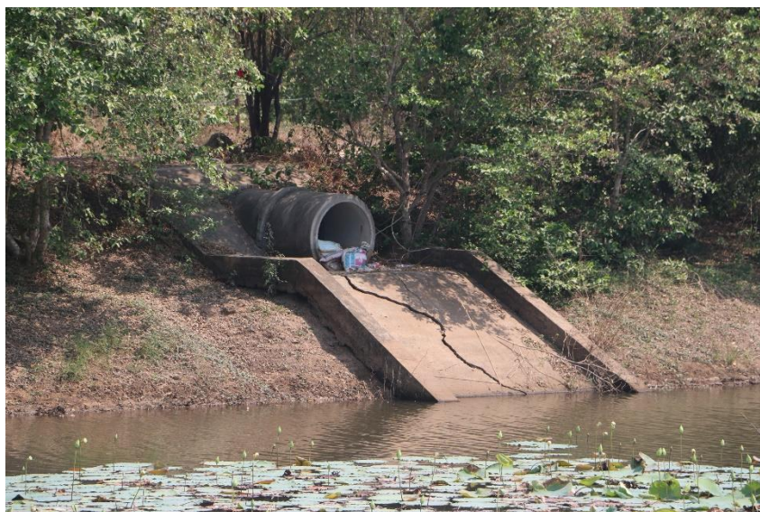
ภาพที่ 15.1.6 หนองยาว มีระบบน้ำเข้าเป็นท่อรับน้ำหลากจากบริเวณใกล้ลำน้ำมูล