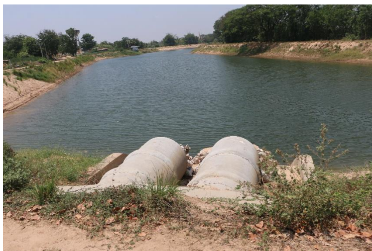
ภาพที่ 15.1.3 มีอาคารประกอบ สภาพใช้งานได้ปกติ