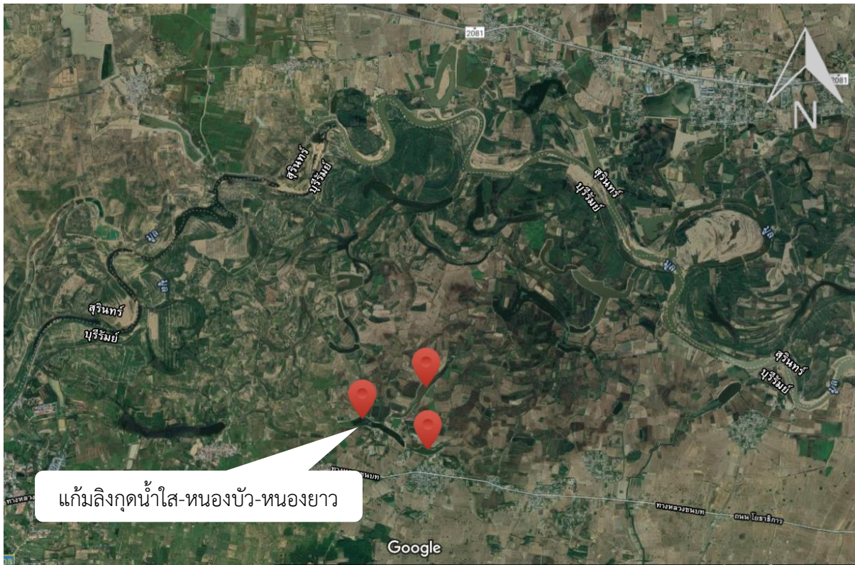
ภาพที่ 15.1.7 แผนที่แสดงที่ตั้งแหล่งน้ำ แก้มลิงกุดน้ำใส-หนองบัว-หนองยาว พร้อมอาคารประกอบ ตำบลสะแก อำเภอสตึก