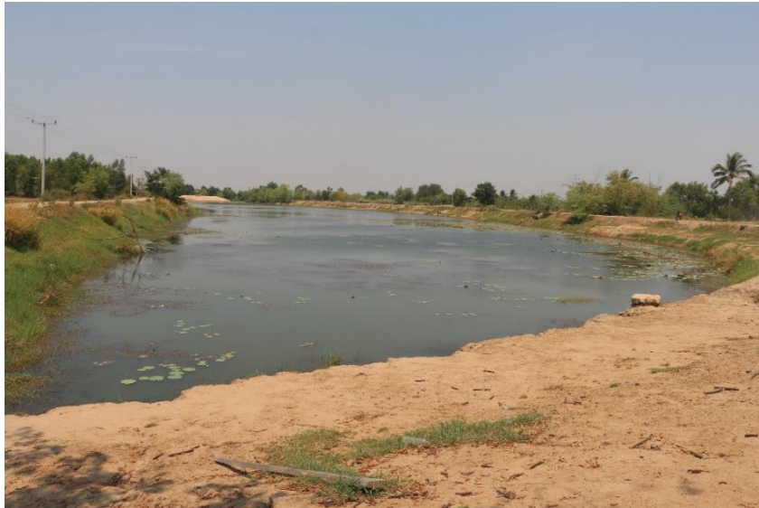
ภาพที่ 15.1.4 กุดน้ำใส-หนองบัว ปัจจุบันมีปริมาณน้ำน้อย