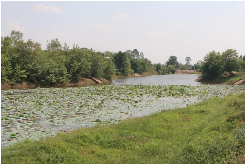
ภาพที่ 15.1.5 หนองยาว ปัจจุบันมีปริมาณน้ำน้อย